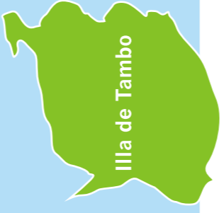
Illas de Tambo